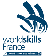
Ne pas redimensionner des éléments/composants.