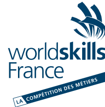
Ne pas effectuer de rotation des éléments/composants.