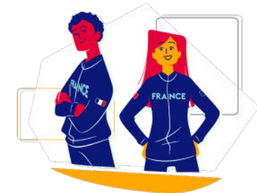
étape 3 PARCOURS INTERNATIONAL