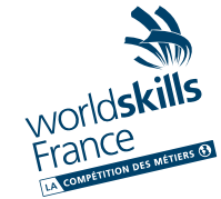
Ne pas effectuer de rotation.