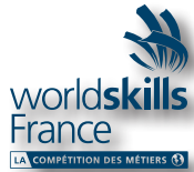
Ne pas ajouter d'ombres portées ou autres effets.