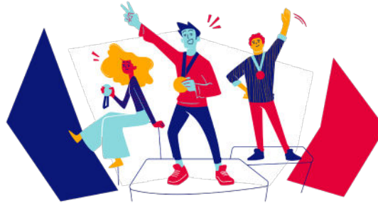
étape 2 PARCOURS NATIONAL