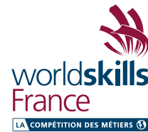
Ne pas changer ou rajouter des couleurs