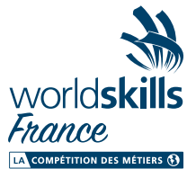
Ne pas modifier des éléments/composants.