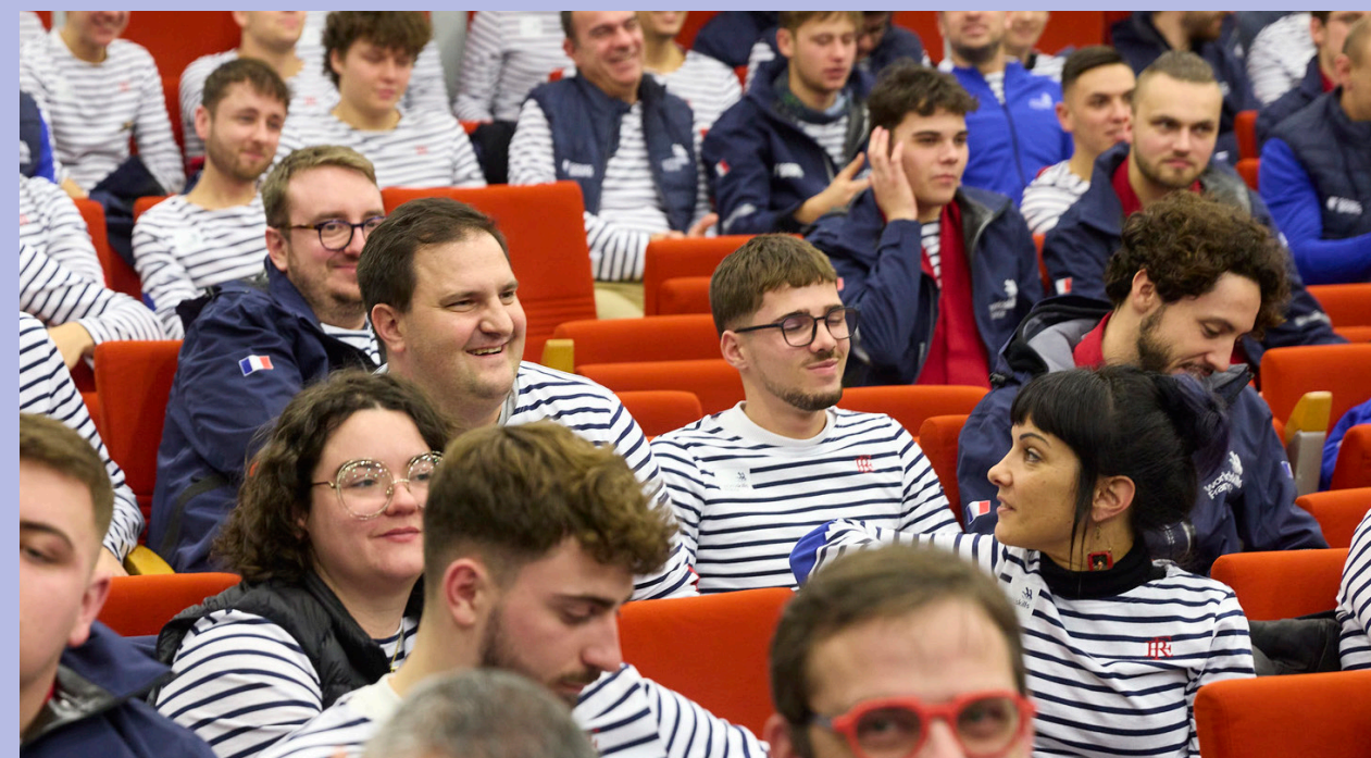
Δ 1 er regroupement de l'Équipe de France des métiers à l'INSEP